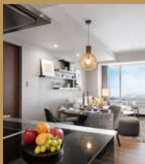
Hinode Hills Niseko Village