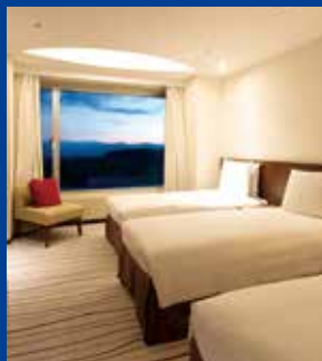
Hilton Niseko Village