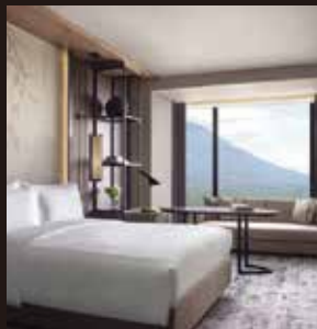
Higashiyama Niseko Village, a Ritz-Carlton Reserve