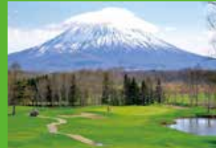
5th HOLE, 214 YARDS, PAR 3