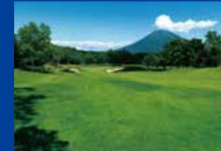
11th HOLE, 418 YARDS, PAR 4