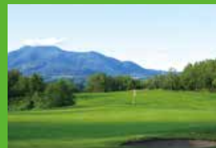
9th HOLE, 507 YARDS, PAR 5