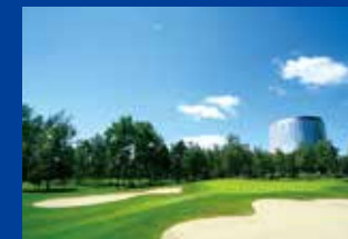
18th HOLE, 387 YARDS, PAR 4