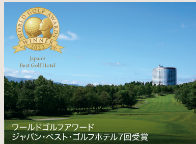
ワールドゴルフアワード ジャパン・ベスト・ゴルフホテル7回受賞